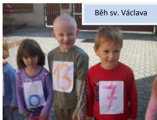
Běh sv. Václava

Drakiáda - 21. října. Děti s pomocí rodičů vyrobili draky, které jsme pak pouštěli na zahradě školy.