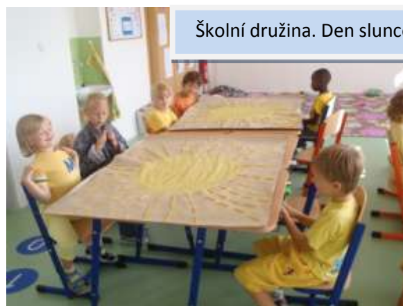
Školní družina. Den slunce

Družina realizovala výchovně vzdělávací činnost ve výchově mimo vyučování zejména formou odpočinkových, rekreačních a zájmových činností a kroužků; umožňovala žákům přípravu na vyučování.