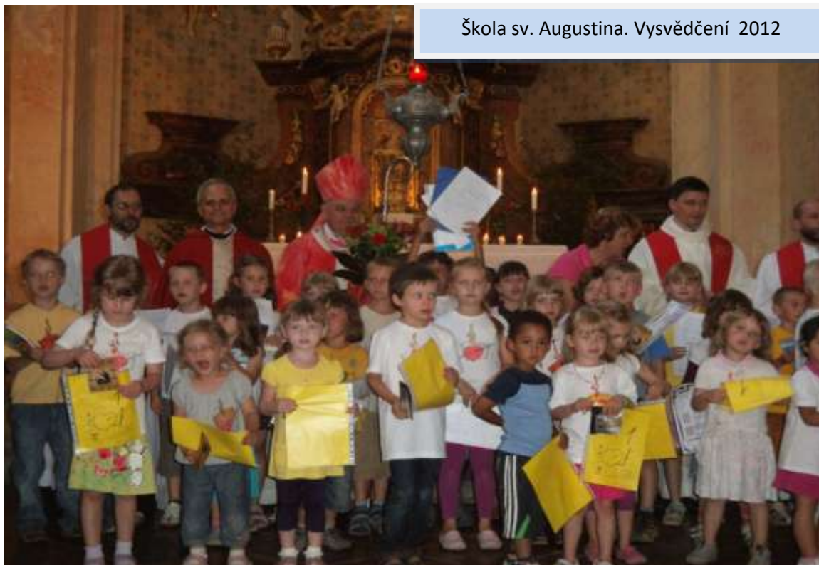
Škola sv. Augustina. Vysvědčení 2012

Všechny děti jediné třídy školy úspěšně absolvovaly první ročník.