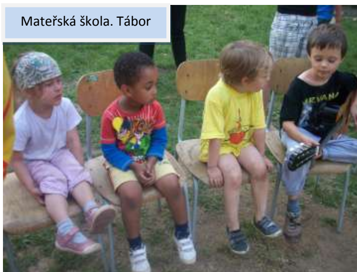
Mateřská škola. Tábor

Škola má vlastní výchovně-vzdělávací program , vycházející z principů augustiniánské pedagogiky, dlouhodobých pedagogických zkušeností a konkrétních podmínek. Čerpá z křesťanských a od toho odvozených morálních a etických hodnot, jako jsou pravda, láska, přátelství, úcta, pokora, tolerance, solidarita, spolupráce, umění darovat i přijímat s láskou a porozuměním, umění odpouštět a další.