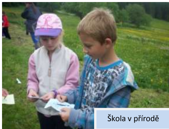
Škola v přírodě

folklor, divadlo, sportovní hry, angličtina, španělština, bádání a objevování, zpěv, manuální práce.