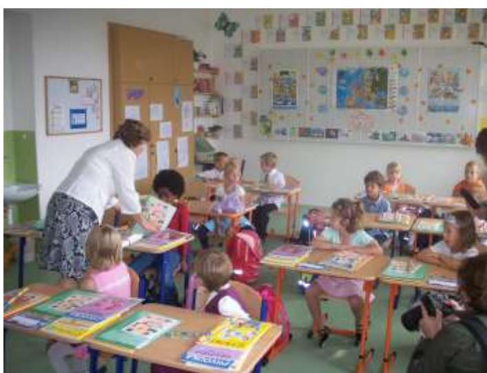
Základní škola. 1. třída. Tagaste