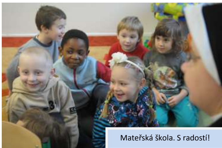
Mateřská škola. S radostí!

V předškolním věku si dítě utváří pohled na svět. Nachází se v počátcích svého citového i sociálního vývoje, učí se poznávat svět všemi smysly. Pro pedagogy, vychovatele i rodiče je to